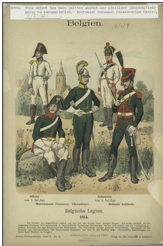
Uniformen Belgisch Legioen in 1814