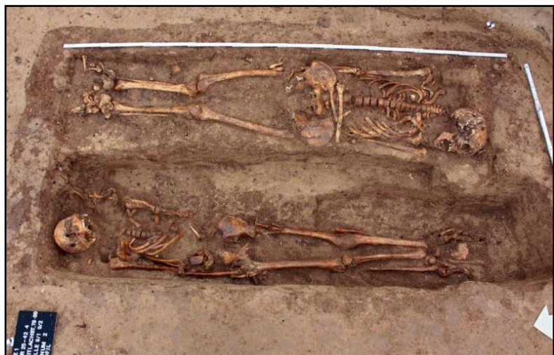
Massagraf van soldaten van Napoleon in Frankfurt