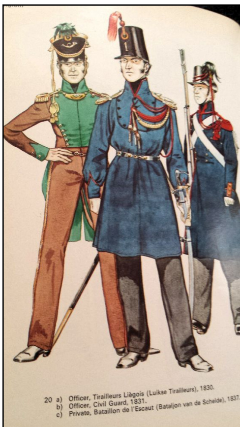
Belgische uniformen rond 1830

aanmerking kwamen voor de legerdienst verwittigd door het gemeentebestuur bij monde van de veldwachter. Dank zij de door de Fransen destijds geïnstalleerde burgerlijke stand, hoefde men geen beroep te doen op de doopregisters van de kerk. Men wist perfect dat er in Kortemark in 1815, 63 jongens geboren waren en men kende ook hun adressen.