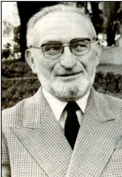
Marnix Gijsen 1899-1984